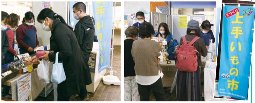
▲令和6年10月開催の「秋の上手いもの市」の様子

市内の障がい者福祉施設が一堂に集まり、自主製作品を販売します。手作りの焼き菓子や雑貨など、他では手に入らないこだわりの品々が並びます。当日に向けて、各施設の利用者の皆さんははりきって製作しています。皆さまのお越しをお待ちしています。