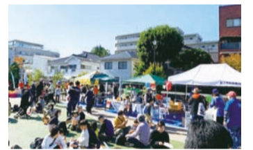
〈昨年のフェスティバル〉

市民活動支援センターをサポートする「こまえくぼ1234応援隊」が、より多くの市民の皆様へ市民活動支援センター「こまえくぼ1234」を知っていただき、関心をもっていただく機会となるように年に2回フェスティバルを開催しています。