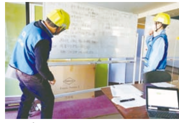
災害ボランティアセンター設置・運営訓練