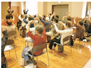
サロン野川でのスペイン舞踊