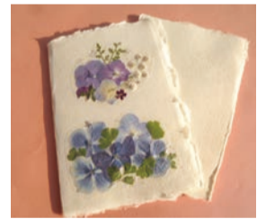
グリーティングカード

ホームページでも紹介しています。 【問い合わせ】 麦の穂 ☎03-3488-8328