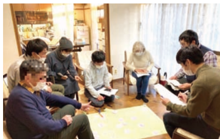
◎こまえ正吉苑エリアでの課題検討の様子

こまえ苑エリアでの立ち上げに続き、こまえ正吉苑エリア及びあいとぴあエリアでも委員会の立ち上げを支援します。