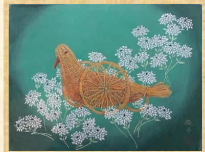
木村 俊子様 作