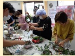
リース作りの様子

また、毎週木曜日の13:00~15:00は本格コーヒーや紅茶を楽しめるカフェもあります。ぜひふらっといらしてください。福祉の専門職も常駐しているので、困りごとのご相談も可能です。