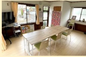
開放的なリビング