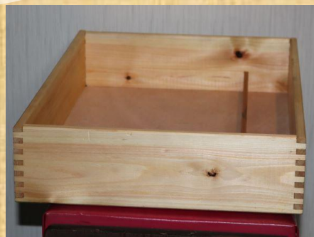
(あられ組)制作：匿名 「卓上置き」