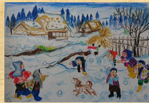
(絵)制作：石川勉様「雪合戦」