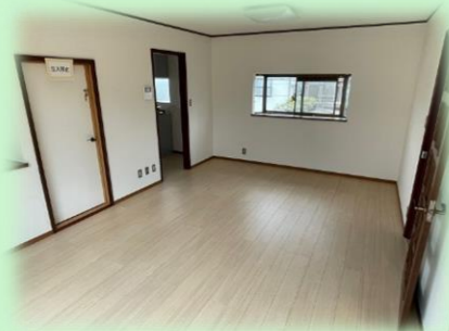
2階リビングは主に子育てひろば等を行います