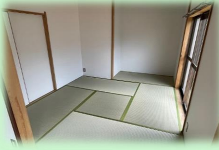
1階と2階に和室が1部屋ずつあります