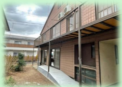
1階はスロープからも入ることができます

運営は社会福祉協議会、こまえ苑、子育ての輪が連携して行っています。専門職も常駐しているので、困りごとなどもお気軽にご相談ください。