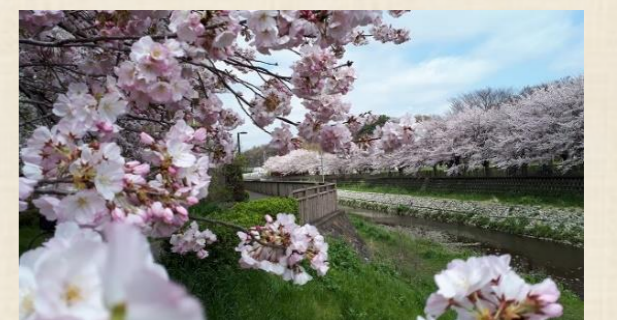
桜の大写し 野川谷戸橋