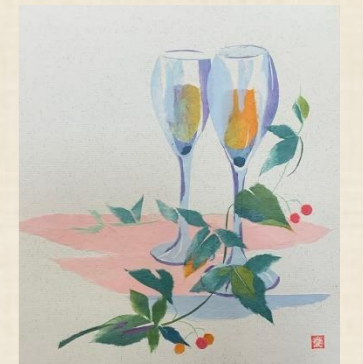
(ちぎり絵)制作:松坂 愛子様