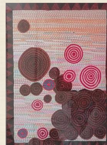
(水性サインペン) 制作:岩崎 菜摘子様「チョコレート」