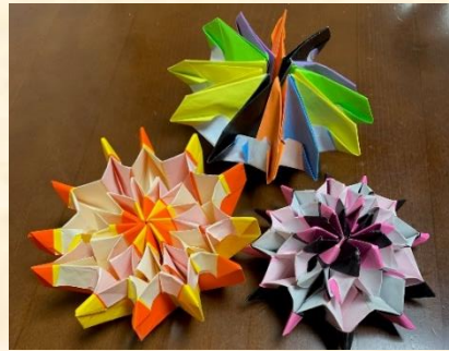
折り紙(万華鏡):MIBOKO 様 3点同じ作品ですが回転して形が変わります