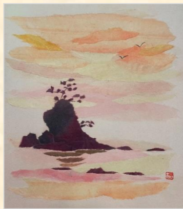
ちぎり絵 松坂 愛子様