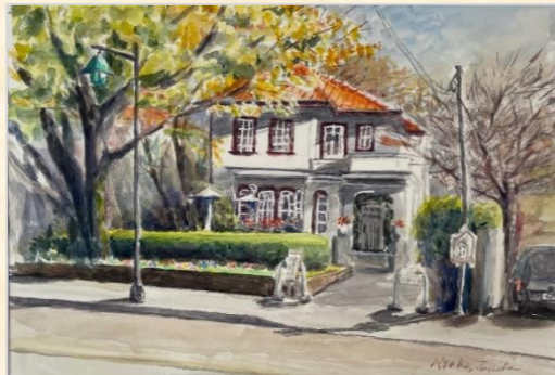
水彩画 田邊涼子様